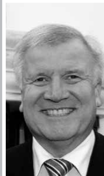
CSU-Chef Horst Seehofer diese Woche in München auf die Frage, ob Bundeskanzlerin Angela Merkel (CDU) heute für einen Erfolg des EU-Gipfels in Brüssel sorgen kann.

„Wenn sie das hinbringt, ist sie die Frau des Jahres.“