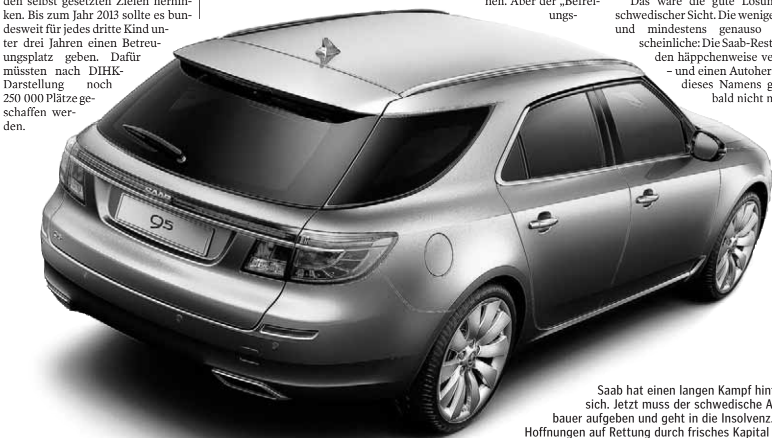
Saab hat einen langen Kampf hinter sich. Jetzt muss der schwedische Autobauer aufgeben und geht in die Insolvenz. Alle Hoffnungen auf Rettung durch frisches Kapital aus China haben sich zerschlagen.

Das wäre die gute Lösung aus schwedischer Sicht. Die weniger gute und mindestens genauso Wahrscheinliche: Die Saab-Reste werden häppchenweise verkauft - und einen Autohersteller dieses Namens gibt es bald nicht mehr.