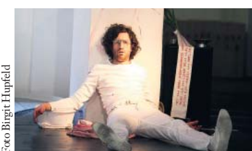
Einer von Jelineks gierigen Anlegern