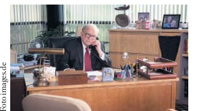
Ed Asner spielt Warren Buffett.

Es trifft nicht nur die Arbeiter: Bobby, Phil und Gene, allesamt leitende Angestellte eines riesigen Konzerns, verlieren während der Krise ihren Job. Bobby kann fortan die Rechnung für den Golfclub nicht mehr bezahlen, Phil muss der Prestigesucht seiner Frau gerecht werden und Gene sich zwischen Ehefrau und Geliebter entscheiden. Am Ende wird aber alles gut, und die drei gründen eine Firma.