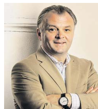
Markus Will

Begonnen hat er mit „Bad Banker“, einem dicken Krimi aus dem Bankenviertel; der Thriller, der er-